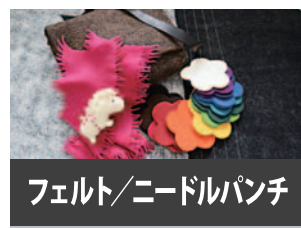
フェルト/ニードルパンチ