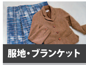
服地・ブランケット