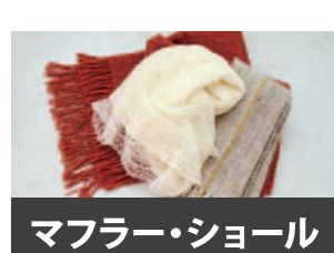
マフラー・ショール

* 品種名の上に記載している国名 (UK, AUS, NZ) は、出典資料の国名です。